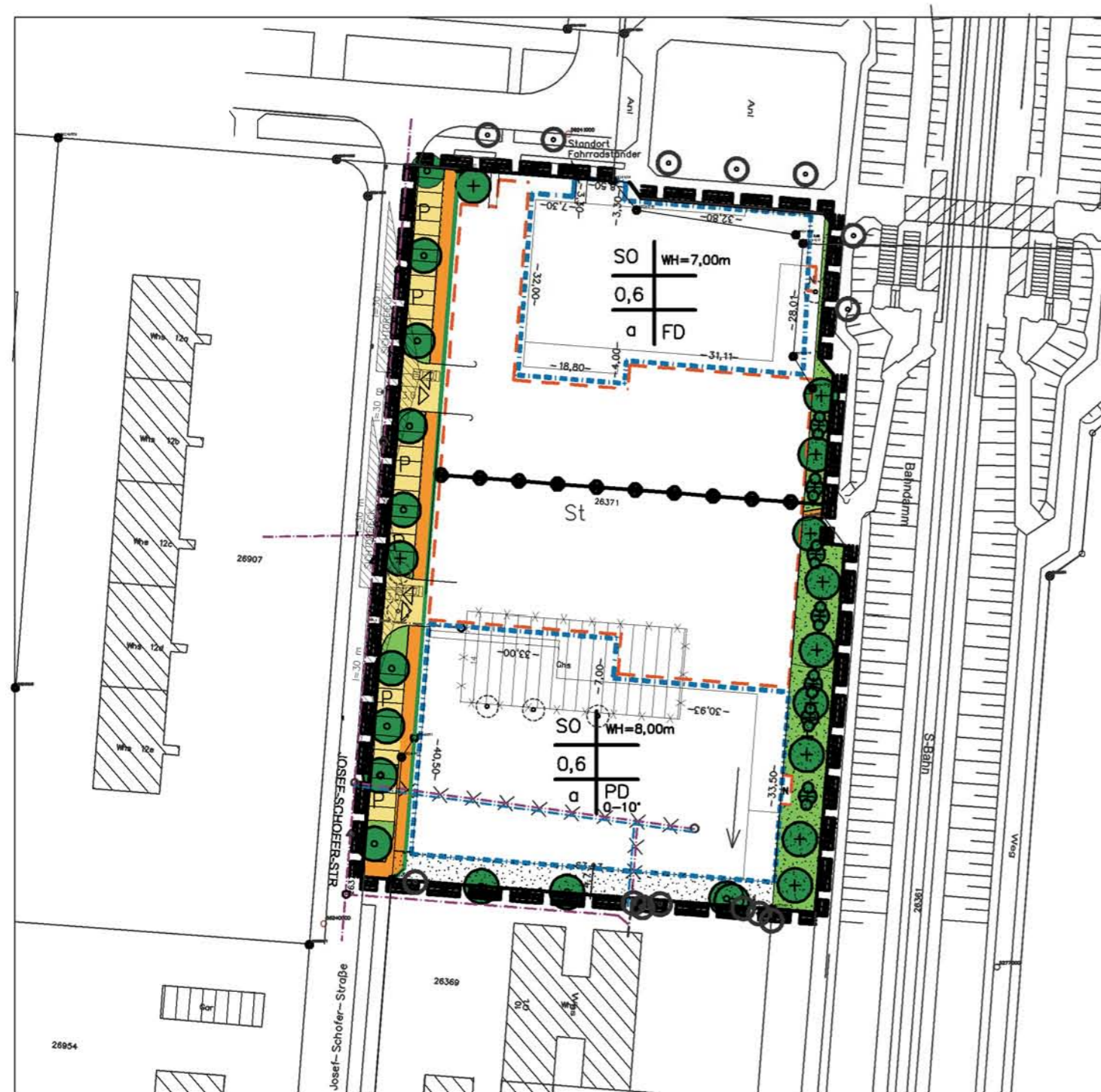
Lageplan M 1:1000

"Nahversorgungszentrum Josef-Schofer-Straße" Karlsruhe – Nordweststadt