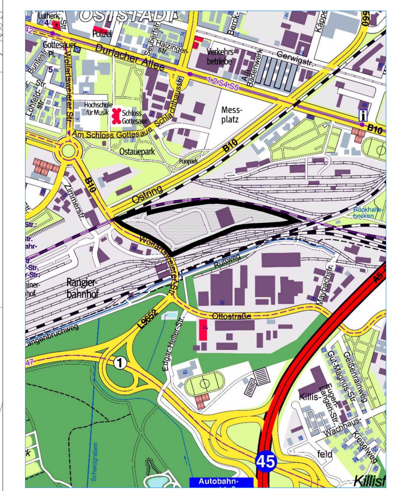
Übersicht, M 1:10.000