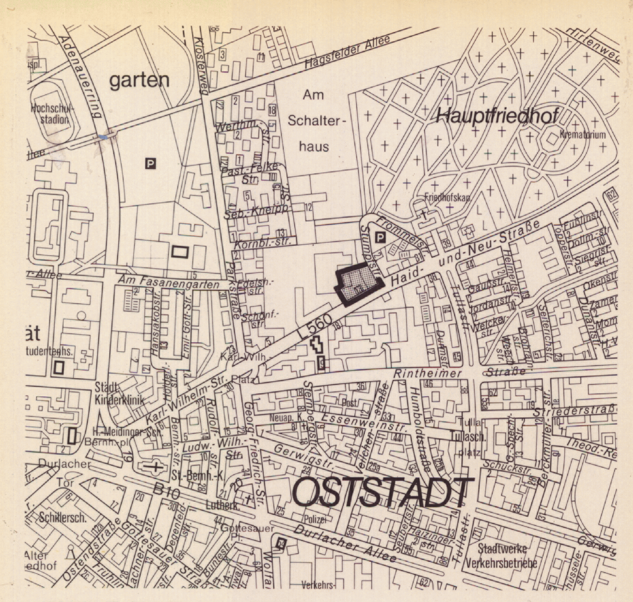
AUSSCHNITT STADTPLAN M.1:10000

Der Auszug aus der Flurkarte stimmt für die im Bebauungsplanbereich dargestellten Flurstücke mit dem Liegenschaftskataster überein. Hiervon abweichende Grenzen laut Grundbuchstand sind wie folgt dargestellt: